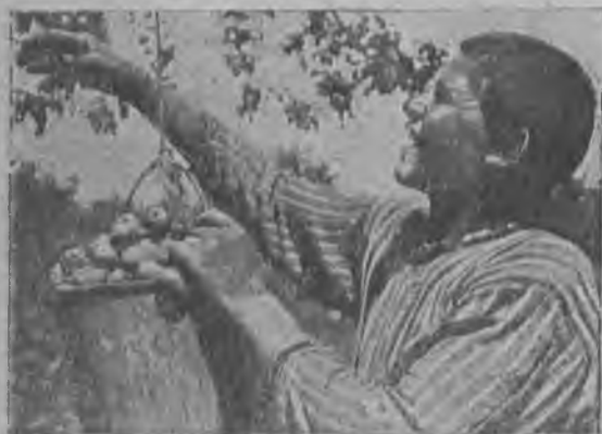
Сбор ранних груш в колхозе «Найдорф» (Сухумский район, Абхазия).

Средне-Волжская крайконтора Заготзерно с помощью В/О Заготзерно должна немедленно на ходу перестроиться для того, чтобы обеспечить бесперебойную приемку, размещение и сохранность хлеба.