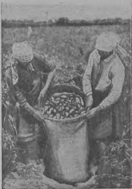
Уборка картофеля в совхозе «Наймитска Перемога» (Одесский район, Украина).