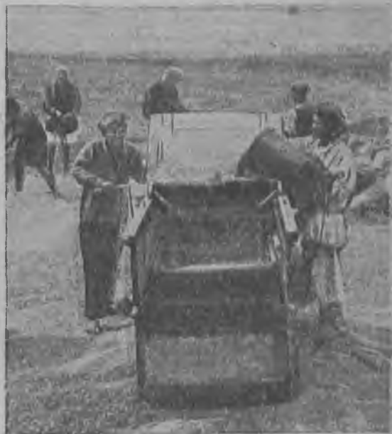
Очистка обмолоченного зерна в бригаде № 3 совхоза «Серп и молот» (Ново-Николаевский район, Н. Волга).