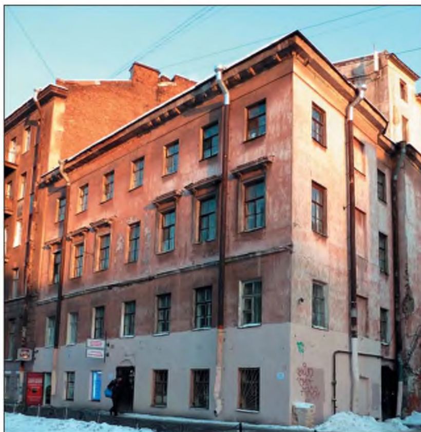
Дом на улице Достоевского (бывшая Ямская) в Санкт-Петербурге, где в 1910-х годах жил С.Ф.Царевский.

Царевский учился в Санкт-Петербургском университете, когда на физико-математическом факультете работала плеяда талантливых биологов. Курс биологии моря читал уже упомянутый К.М.Дерюгин, паразитологии и энтомологии — А.К.Мордвилко (1867—1938), энтомологии и зоогеографии — М.Н.Римский-Корсаков (1873—1951), зоологии беспозвоночных — В.А.Догель (1882—1955), генетики — Ю.А.Филипченко (1882—1930) [4].