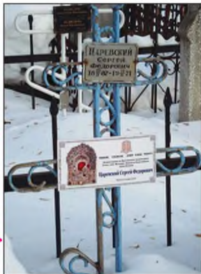
Могила С.Ф.Царевского в православном некрополе Арского кладбища при Храме Ярославских Чудотворцев в Казани.

Щапова и Комлева. Здесь издавна был «академический» район Казани, где поселялись профессора, врачи, юристы и другие представители интеллигенции.