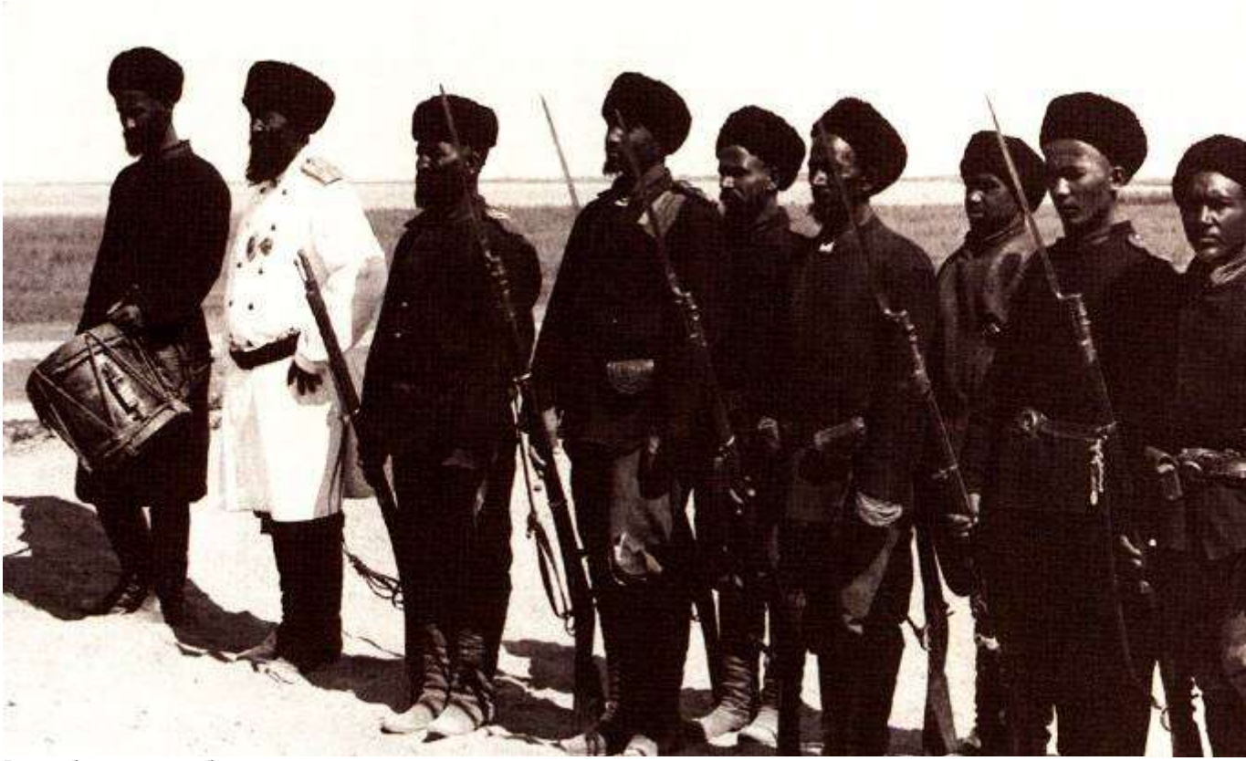
Взвод бухарских сарбазов.